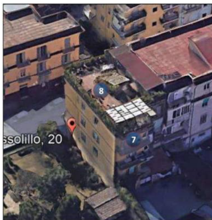
Figura 5 – Punti di misura presso abitazione 2° piano in via P. G. Russolillo, civ. 13 – Napoli (NA).