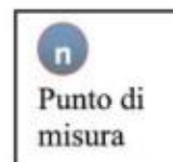
Figura 3 - Punti di misura presso "Vocazionario Deus Caritas" in via P. G. Russolillo, civ. 14 – Napoli (NA).