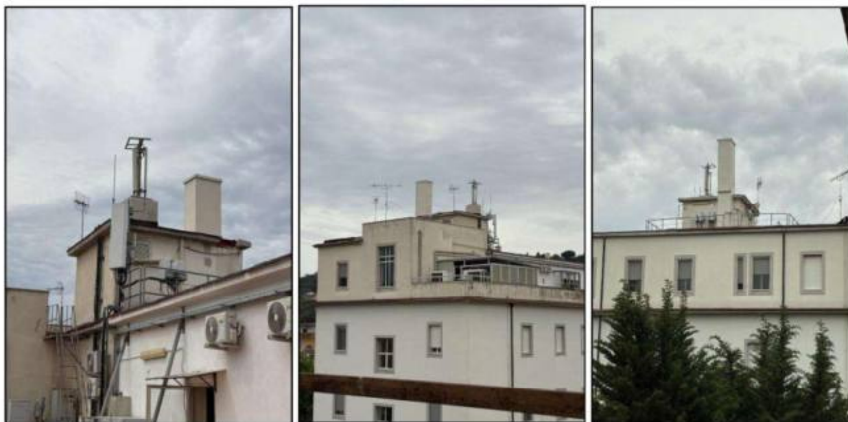
Figura 2 – Foto Sorgenti RF "Apparati e/o Impianti di Radio Telecomunicazioni".